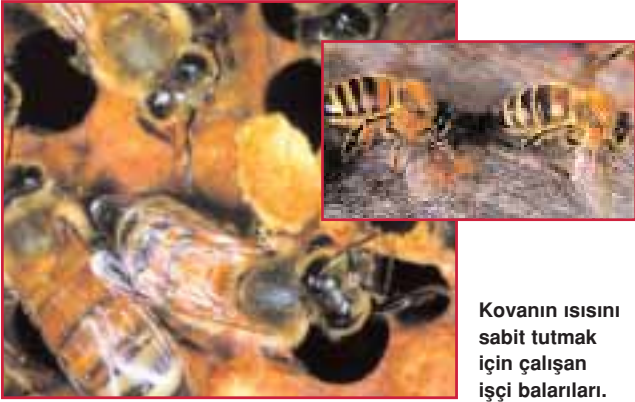
Kovanın ısısını sabit tutmak için çalışan işçi balarıları.

lem yeterli olmayacağı için arılar daha şiddetli bir soğutma yöntemi kullanmak zorundadırlar. Böyle durumlarda, sulandırılmış bal damlalarını boş hücrelerin ağızlarına yerleştirirler. Kanatları ile oluşturdukları hava akımı bu damlaların içerisindeki suyu buharlaştırır. Bu soğutma sistemiyle kovanın ısı kısa sürede eski haline döner. 2